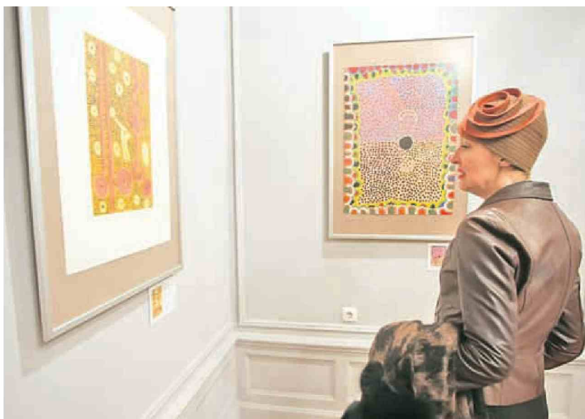
Изложба у Музеју примењених уметности